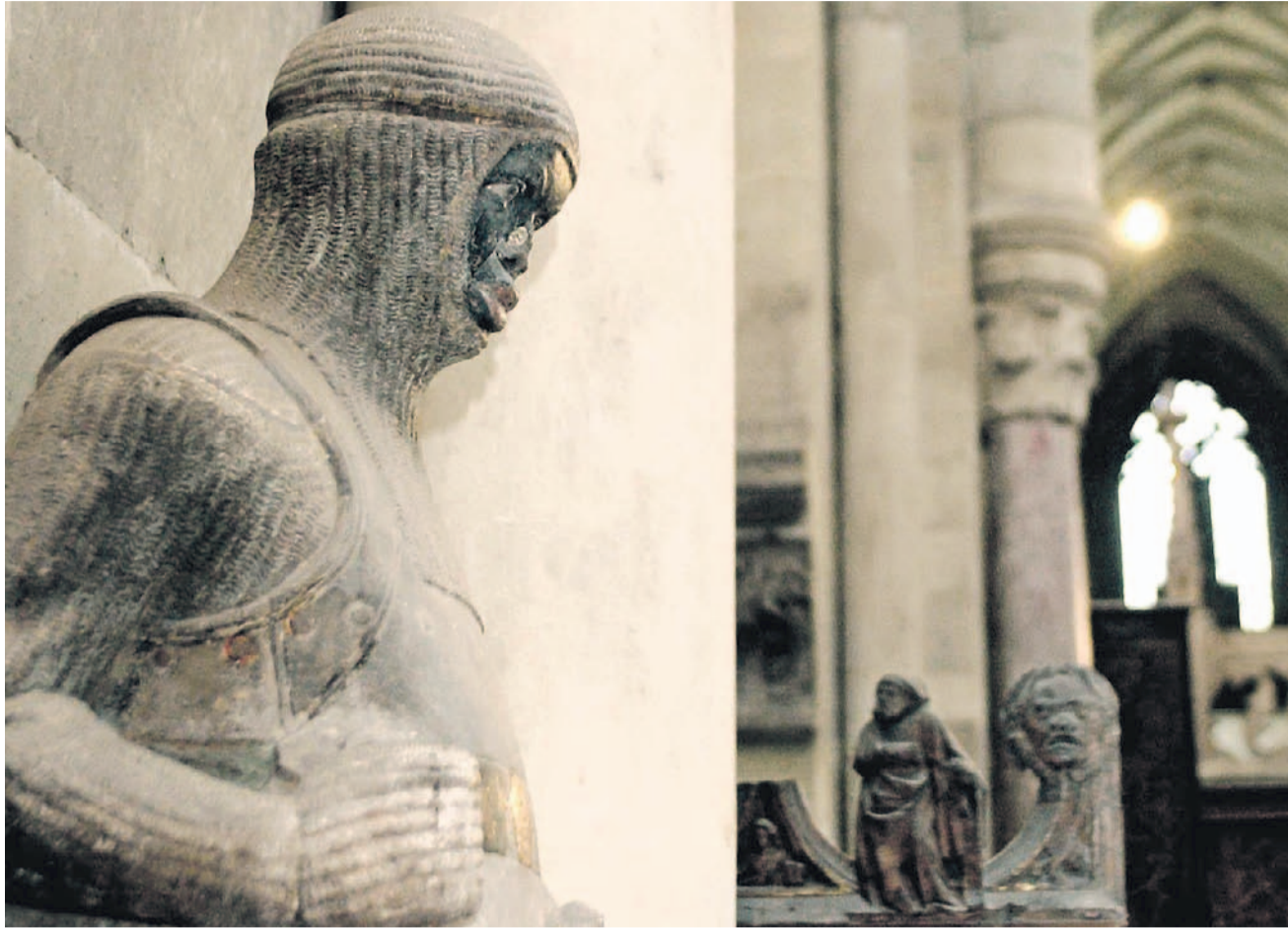
Mauritius: Die Statue des Schutzpatrons entstand um 1240.

Solche Planungsskizzen werden bald nach Gebrauch vernichtet. Zwei erhaltene Konstruktionszeichnungen lassen die Perfektion der statisch versierten Konstrukturen des Mittelalters erkennen. Ihre himmelstrebenden Säulen und lichtdurchfluteten Gewölbe verherrlichen Gott. Im Innern bergen sie unschätzbare Kleinodien und Reliquien, die Ströme von Pilgern anziehen. Ein Stück aus dem Rost des Heiligen Laurentius, ein Finger der Heiligen Katharina, das Münsteraner Armreliquiar der Heiligen Felicitas: In Magdeburg wird der Wert dieser Heiligtümer für Liturgie und Volksfrömmigkeit deutlich.