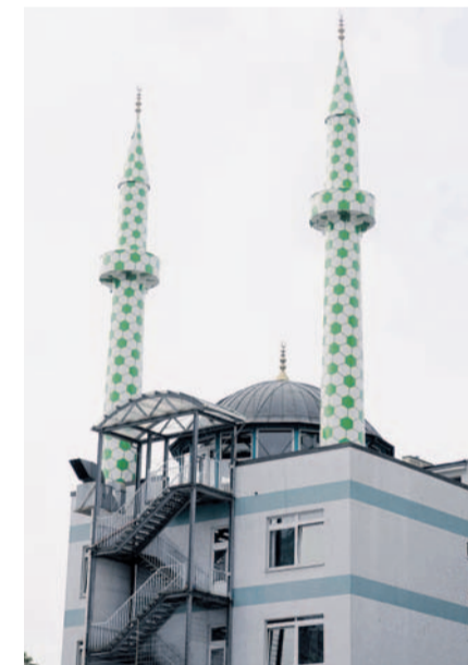
Zeichensprache: „Darf ich mal ihr Minarett anmalen?“, fragte der Künstler.

Eine Ausstellung im Kuppelsaal der Centrum Moschee ist für Interessierte geöffnet bis 4. Oktober 2009. Do/Fr 14–18 Uhr, Sa/So 12–16 Uhr. Böckmannstr. 40, 20099 Hamburg. Internet: www.minarett.de